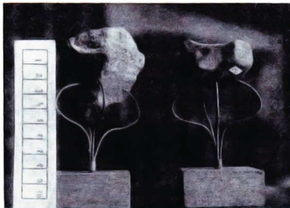
Fig. 2 Fragmentos de los meteoritos de Garraf y Cañellas, existentes en el mismo Museo. El primero muestra en su parte anterior claramente impresiones digitales. En el segundo se ve, en contacto con los apoyos, la costra negra característica.

mencionado, es el mayor que se conserva en España, mide 39 x 40 x 29 cm. y figuró en la Exposición Universal de París de 1867. Su superficie cubierta de costra ha pasado del negro al ocráceo y en su interior también ha habido alteración oxidándose. Contiene partes cristalinas brillantes y pequeñas, formando venas y geodas; hialinas y de composición semejante al feldespato; y granos menores, negros, de hierro cromado. Meunier halló la siguiente composición: silicato vecino al peridoto 38,7 %, silicato vecino al piroxeno 24,6 %, hierro niquelado 15 %, troilita (sulfuro de hierro) 20,5 %, hierro cromado y fosfuros. Además por su estructura lo asoció al tipo Cantonita como el meteorito de Nuiles (Faura y Sans, Op. cit.).